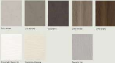
Letteratura Latta tortora Latta nera Olivo scuro Olivo scuro